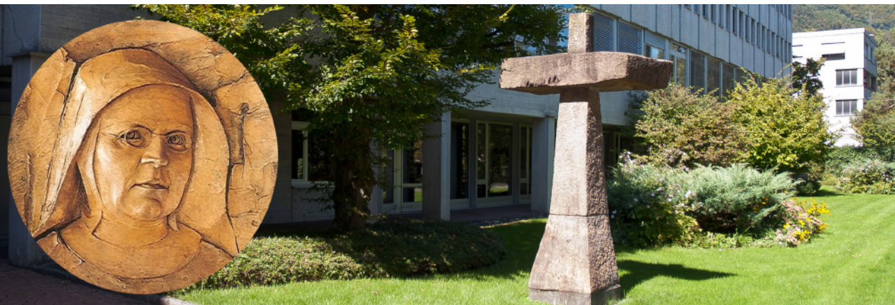
Steinkreuz und Collage.